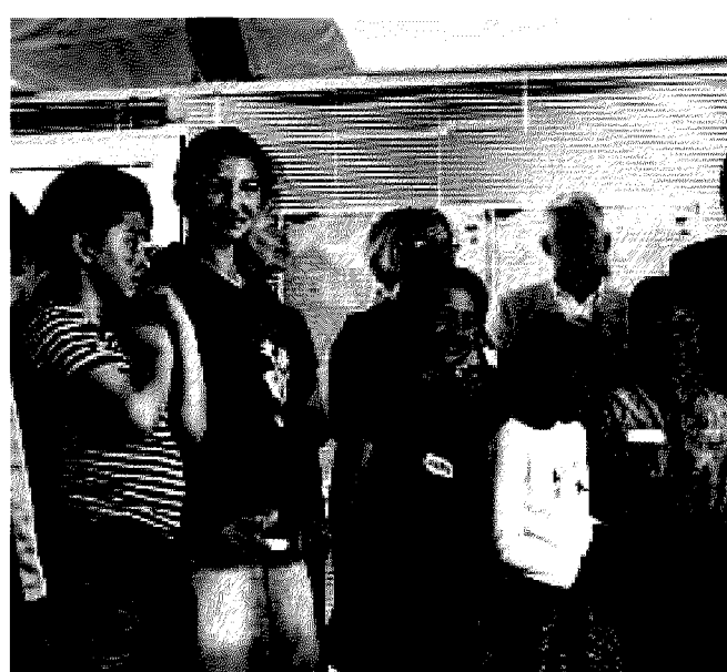
Edizione 2010 Un momento della premiazione dei bambini rom

gli elaborati presentati per il concorso. Tema della nuova edizione: il «Pianeta vivente», scelto in collaborazione con l'Agenzia Spaziale Europea, e ispirato alla campagna mondiale Living Planet del Wwf. I lavori sono stati valutati da una giuria di esperti, presieduta dal direttore dell'Ansa, Luigi Contu. I servizi sono pubblicati su internet ( www.giornalisticnell'erba.org ). Scrivono, scattano, registrano: i «gNe» hanno dai 5 ai 21 anni. Dal 2006 hanno partecipato al concorso oltre 4 mila ragazzi. I numeri sono in crescita esponenziale: dai 50 partecipanti del primo anno, si è passati ai 2528 della quarta edizione, provenienti da 17 regioni italiane. Il progetto raggiunge attualmente 920 mila ragazzi (che gareggiano da soli o con la propria classe). Altra novità: la sezione internazionale con elaborati in